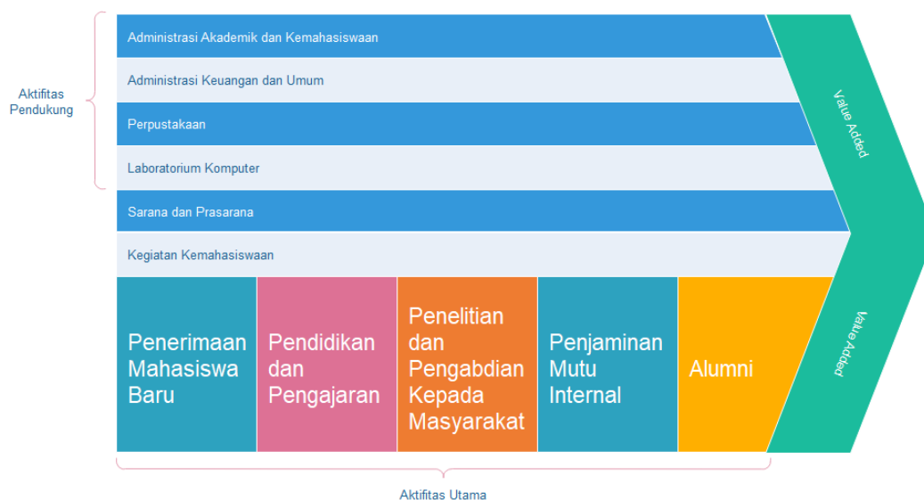
Gambar 4. Rantai Aktifitas

Analisis ini bertujuan untuk mengenali aspek-aspek strategis pada STMIK WICIDA sehingga diperoleh gambaran yang jelas dari kebutuhan institusi saat ini. Alat yang digunakan untuk melakukan analisis ini adalah Value Chain Analysis . Rantai aktivitas pada STMIK WICIDA dapat dilihat pada Gambar 4.